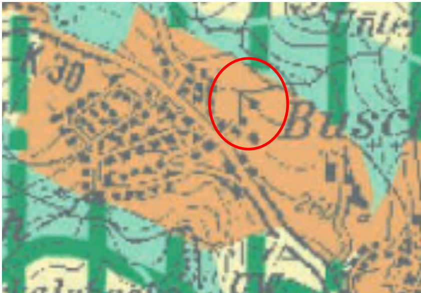
Abb. 3: Ausschnitt aus dem Regionalplan Köln Teilabschnitt Region Köln (ohne Maßstab)