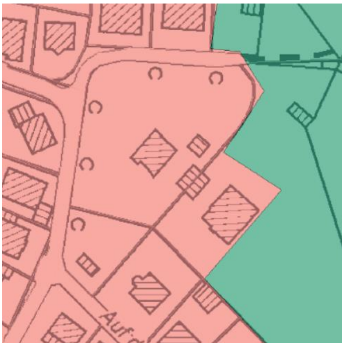
Abb. 4: Flächennutzungsplan Gemeinde Kürten (ohne Maßstab)

Der Flächennutzungsplan der Gemeinde Kürten aus dem Jahr 2009 stellt für das Plangebiet „Wohnbaufläche“ dar. Der vorliegende Bebauungsplan kann dementsprechend als aus dem Flächennutzungsplan entwickelt angesehen werden. Lediglich der geplante Wendehammer liegt mit einer kleinen Teilfläche in der Darstellung von Waldfläche. Da der Flächennutzungsplan ebenso wie der Landschaftsplan (siehe Kapitel 4.3) allerdings nicht parzellenscharf ist, besteht kein planerischer Widerspruch.