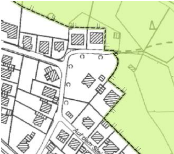
Abb.5 Landschaftsplan Rheinisch-Bergischer Kreis (ohne Maßstab)

Mit der in Aufstellung befindlichen 11. Änderung sollen östlich keine Waldflächen unmittelbar angrenzen.