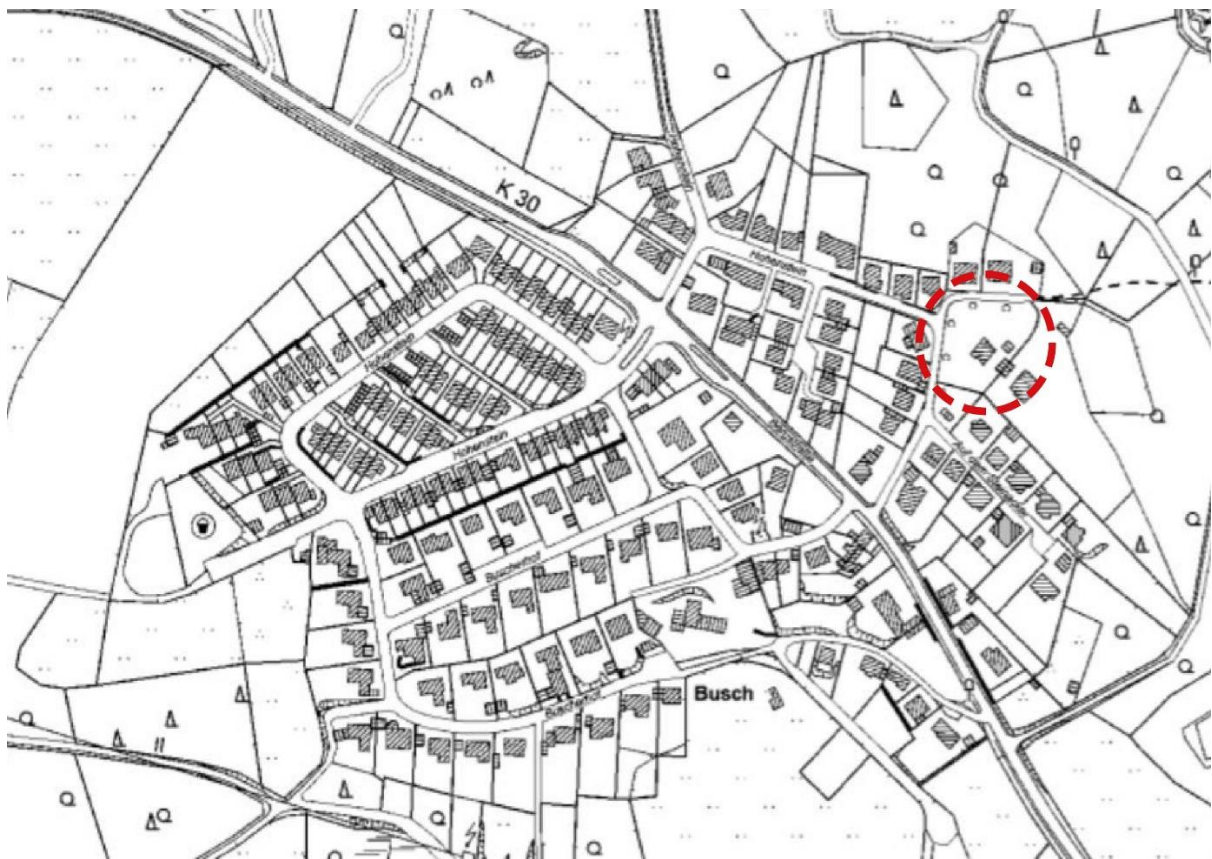
Abb. 1: Lage im Ortsteil Busch (ohne Maßstab)

Im Nordosten der Ortslage Busch in der Gemeinde Kürten liegt das Grundstück Auf dem Steinacker 8, welches rd. 2.600 m 2 groß und mit einem Wohnhaus bebaut ist. Aufgrund der hohen Grundstücksgröße und dem auch in Kürten vorhandenen Bedarf an Wohnraum sollen drei weitere Wohnhäuser im Norden des Grundstückes entstehen. Das bestehende Wohngebäude bleibt bestehen. Die drei zusätzlich entstehenden Grundstücke sollen von Norden über die Straße Auf dem Steinacker erschlossen werden. Die Erschließung des bestehenden Grundstückes soll, anders als im Bestand von Osten, in Zukunft von Westen erfolgen.