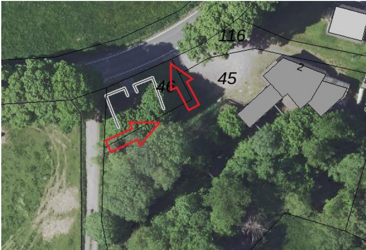
Abbildung 1: Orthophoto Bereich Denkmal

Seitens der Gemeinde Kürten wurde das Büro Holzem & Hartmann GmbH & Co. KG beauftragt, die Ausfahrtmöglichkeit über das Grundstück des nahegelegenen Denkmals und das Schützenhaus zu überprüfen.