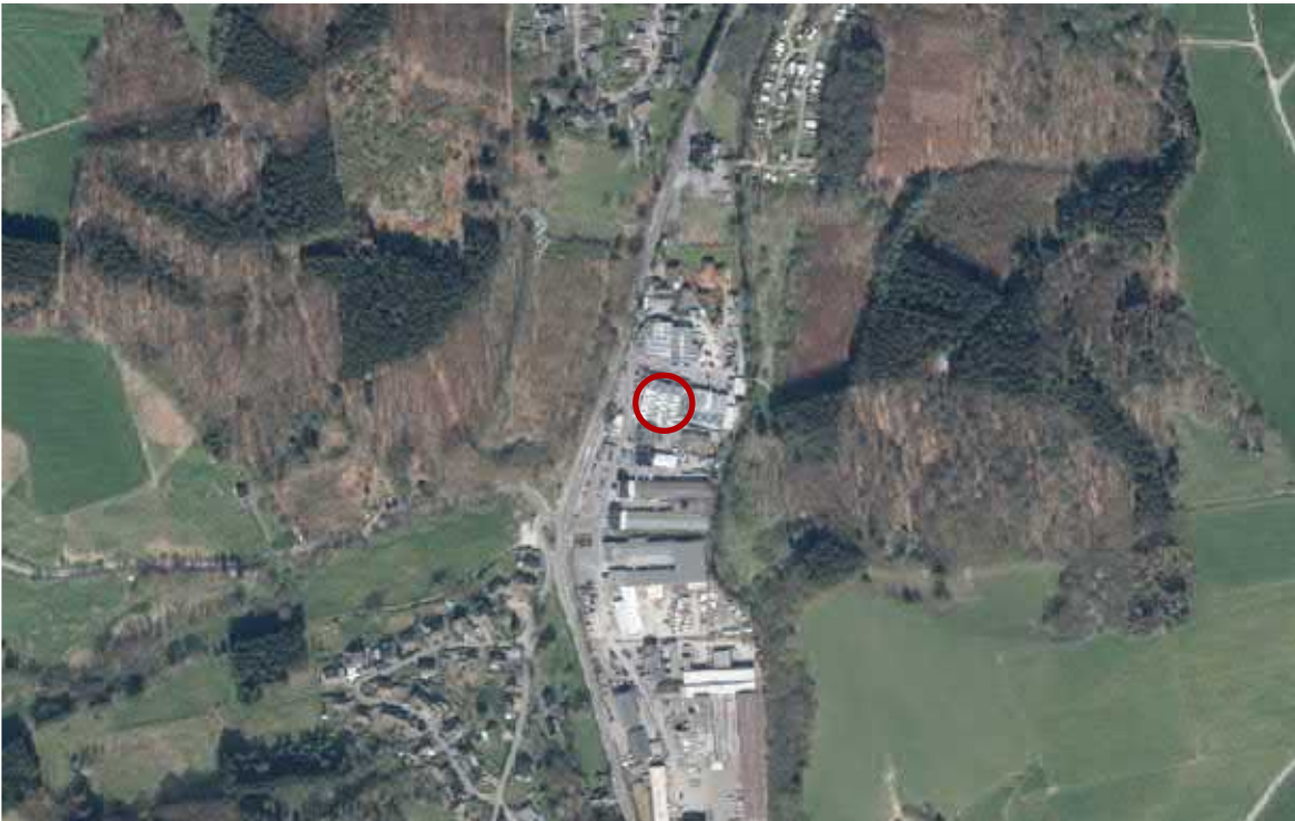
Abb. 3: Luftbild mit Planstandort