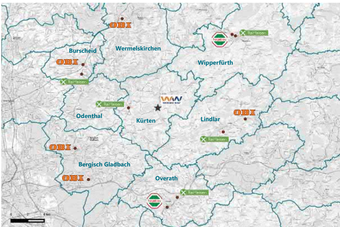
Abb. 9: Wettbewerbssituation für das Planvorhaben