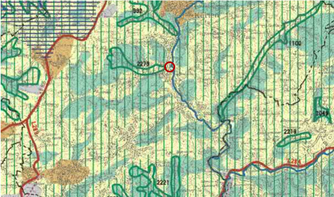
Abb. 1: Regionalplan für den Regierungsbezirk Köln, Teilabschnitt Region Köln mit Planstandort